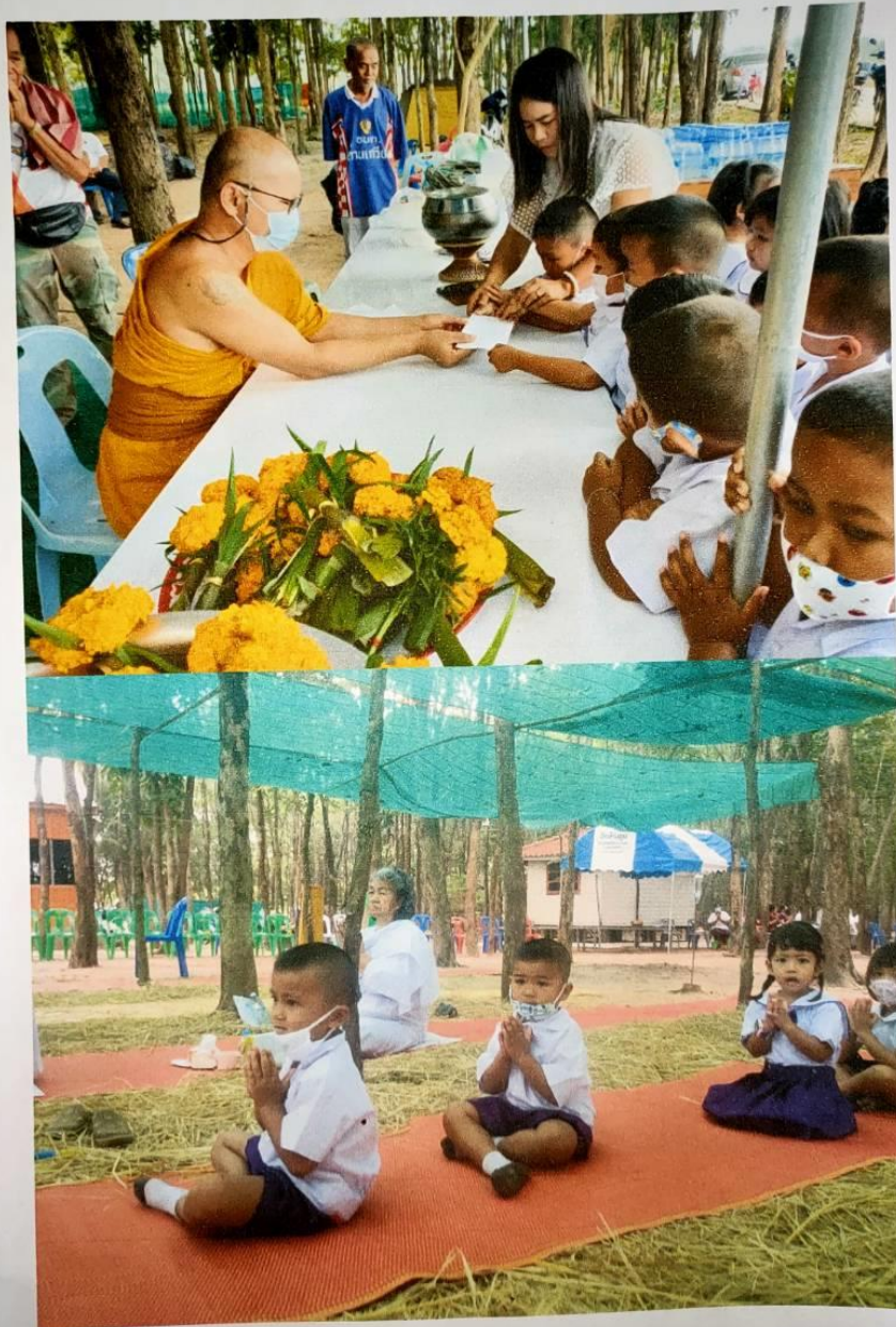
ภาพโครงการการส่งเสริมคุณธรรม จริยธรรม ของศูนย์พัฒนาเด็กเล็กองค์การบริหารส่วนตำบลด่านเกวียน ระหว่างวันที่ ๙ - ๑๔ ธันวาคม ๒๕๖๓ ณ วัดบ้านตุม หมู่ที่ ๕ ตำบลด่านเกวียน อำเภอโชคชัย จังหวัดนครราชสีมา